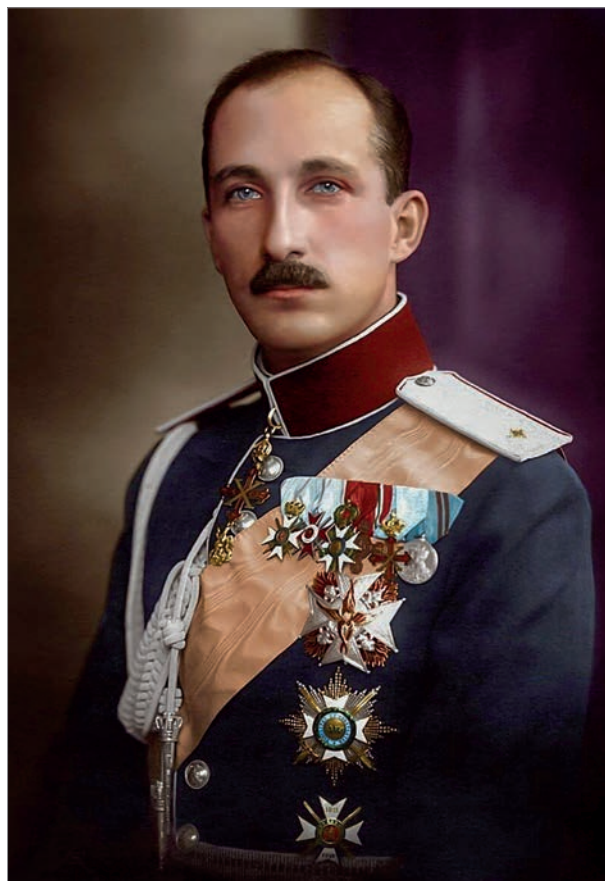
Официальный портрет царя болгар Бориса III

Николай II принял болгарскую делегацию и дал согласие быть крестным отцом. Таинство миропомазания будущего царя Бориса III совершил в Софии экзарх - митрополит Иосиф 2 февраля 1896 года. Восприемника Николая II на таинстве представлял князь Голенищев-Кутузов, потомок князя Михаила Илларионовича Голенищева-Кутузова-Смоленского.