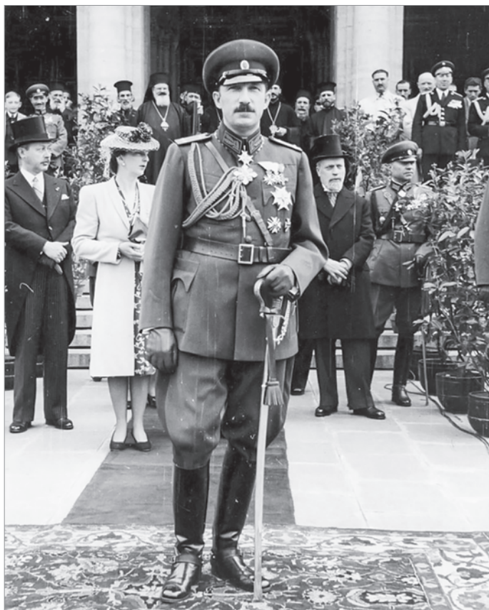
Царь Борис III с царицей Иоанной Савойской на ступенях храма Святого Александра Невского в Софии после богослужения. В этом храме в 1930 г. царская чета венчалась, а в 1943 г. Болгария прощалась со своим царем Борисом III

Многие исследователи склоняются к версии о насильственной смерти. Другие считают, что смерть наступила в результате нервной перегрузки и физического истощения, особенно обострившихся после последнего посещения царем Борисом ставки Гитлера. При этом среди сторонников первой версии нет единства относительно причастных к смерти царя.