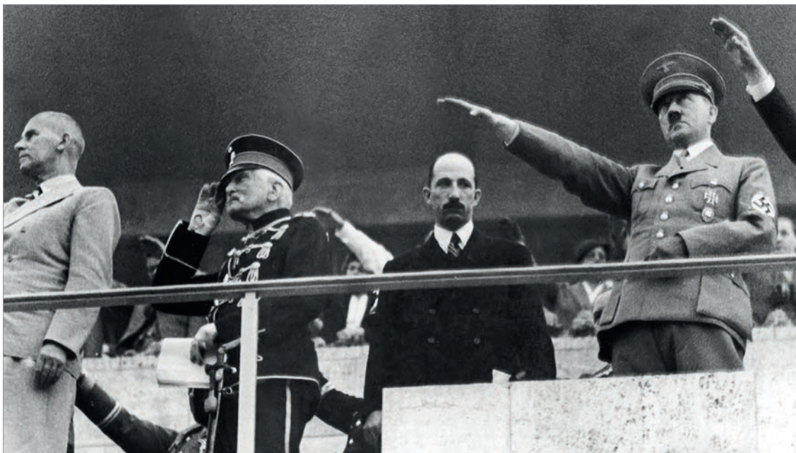
На открытии XI летних Олимпийских игр в Берлине. По приглашению Гитлера Борис III возглавляет болгарскую делегацию. 1 августа 1936 г.

земледельцев (БЗНС) и большей части болгарского народа, занял твердую позицию в этом вопросе.