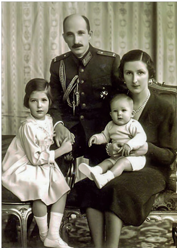
Царь Борис III с женой царицей Иоанной Савойской, дочерью Марией Луизой и сыном - наследником престола Симеоном II

3 октября 1918 года, вступая на болгарский престол, царь Борис III опубликовал манифест «К болгарскому народу», в котором, в частности, провозгласил: «Рожденный на прекрасной болгарской земле и будучи духовным чадом православной веры, выросший в среде моего любимого народа... я торжественно заявляю, что буду чтить Конституцию и верно и преданно служить на благо народа».