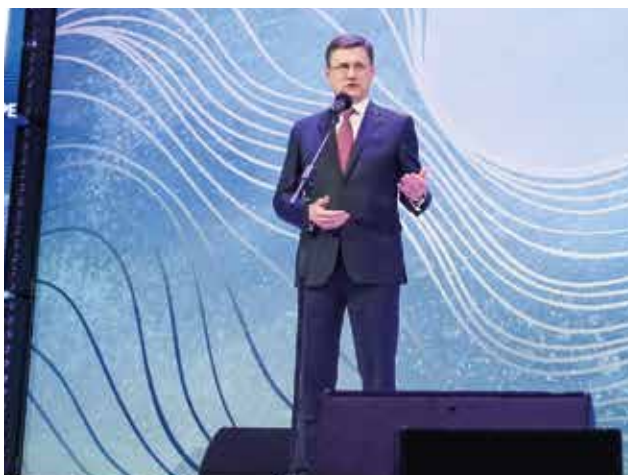
А. В. Новак Заместитель Председателя Правительства Российской Федерации