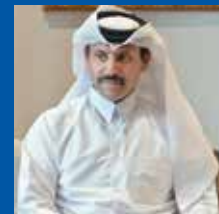
АХМЕД БЕН НАСЕР БЕН ДЖАСИМ АЛЬ ТАНИ

ЧРЕЗВЫЧАЙНЫЙ И ПОЛНОМОЧНЫЙ ПОСОЛ КАТАРА В РОССИИ