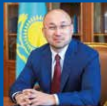
ДАУРЕН АСКЕРБЕКОВИЧ АБАЕВ

ЧРЕЗВЫЧАЙНЫЙ И ПОЛНОМОЧНЫЙ ПОСОЛ РЕСПУБЛИКИ КАЗАХСТАН В РОССИЙСКОЙ ФЕДЕРАЦИИ